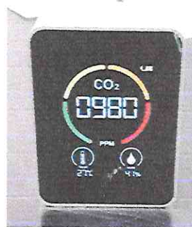
Medidor de Ozono marca 27 °C, 0980 ppm de CO 2 y 41% de humedad, aun estando el ventilador funcionando de frente

Esta situación ya ha generado dos eventos con sustancias químicas peligrosas (volátiles) que podrían haber sido graves, pero afortunadamente la acción de los profesores ayudó a aminorar los daños.