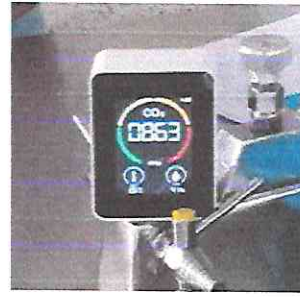
Aquí marcaba 26°C, 41% de humedad y 863 ppm de CO 2 , siendo las 08:30 hr

En nuestra experiencia (técnicos del laboratorio) todos los días se vive un ambiente de malos olores y mala ventilación (sofocación e irritación ocular y laríngea) cabe señalar que se percibe aun más por las mañanas que ha estado cerrada el área, por tal motivo se trata de contrarrestar abriendo todas las puertas, accionado las tres extractores y ventilador de pedestal pero aun así es mínima la mejoría del ambiente, hay días que después de las 10:00hr con los laboratorios ocupados por las sesiones se siente mucha sofocación por la falta de oxígeno.