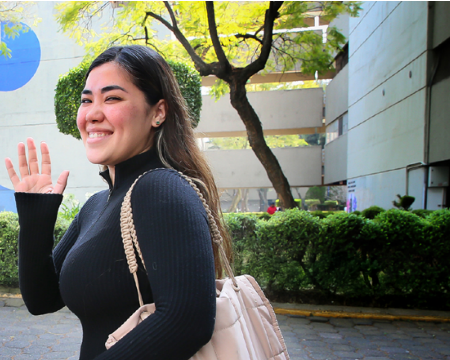
Unidad Xochimilco / DCS UAMFoto / Alejandro Juárez Gallardo.