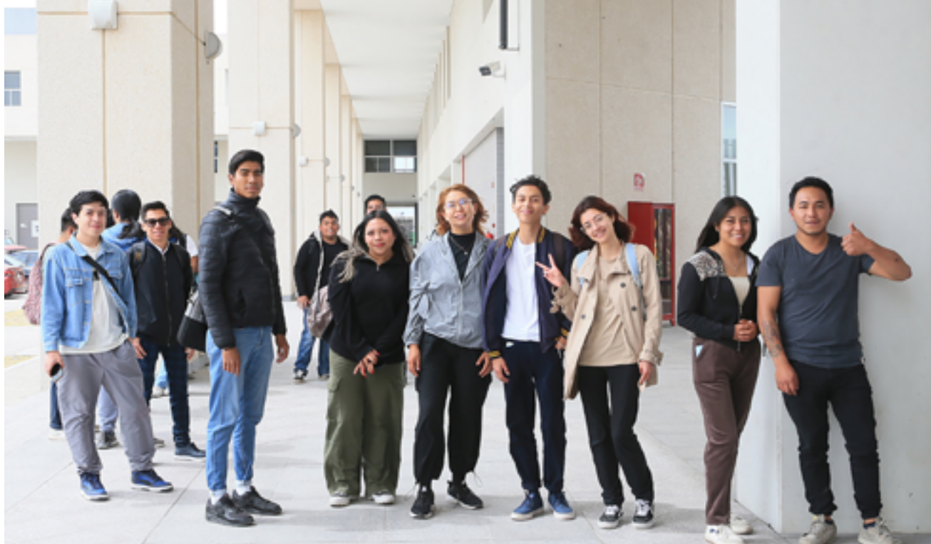
Unidad Lerma / DCS UAMFoto / Alejandro Juárez Gallardo.